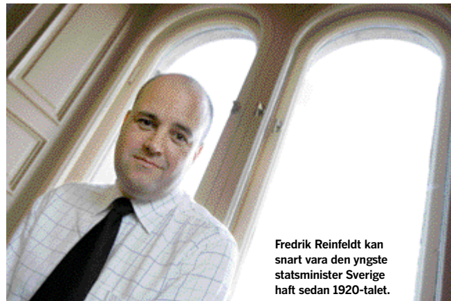
Fredrik Reinfeldt kan snart vara den yngste statsminister Sverige haft sedan 1920-talet.